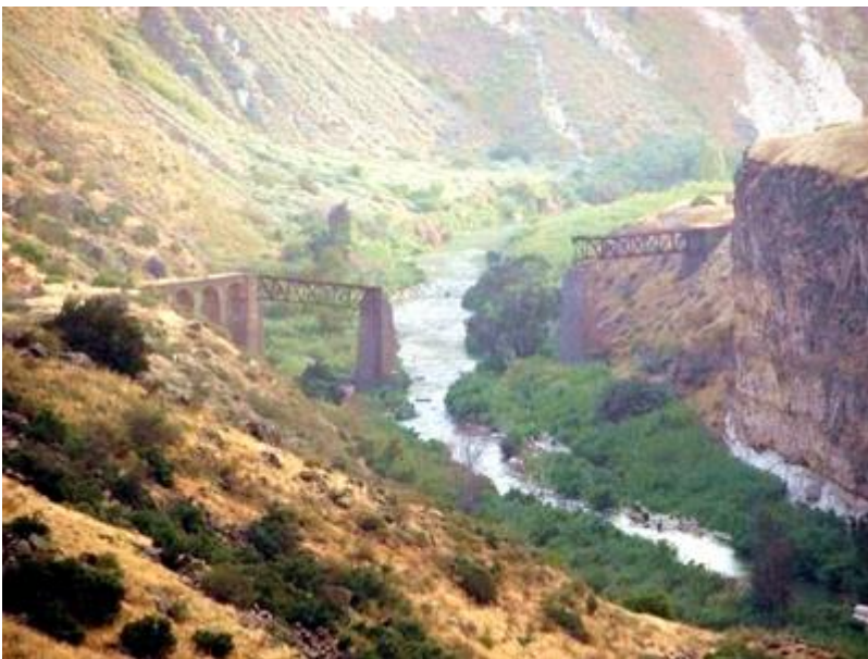
La valle del Giordano

Alcuni ambientalisti affermano che il fiume stesso è in pericolo di morte nella Valle del Giordano.